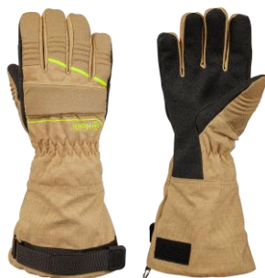
HUNTER Long Beige