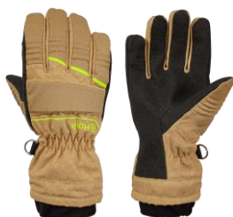
HUNTER Evo Beige