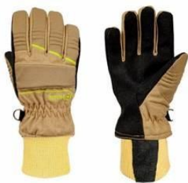
HUNTER Short Beige