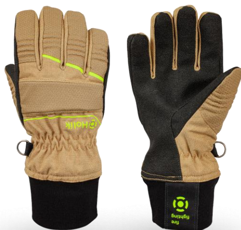
HUNTER Flexi Beige

Zásahová textilní rukavice s extrémně odolným vláknem PBI®. Propracovaný systém výztuh ještě zvyšuje mechanickou a tepelnou odolnost. Na exponovaných místech je rukavice navíc opatřena keramickým povrstvením pro vyšší odolnost proti oděru.