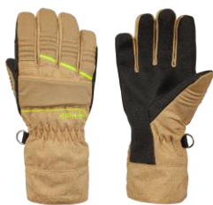
HUNTER Easy Beige